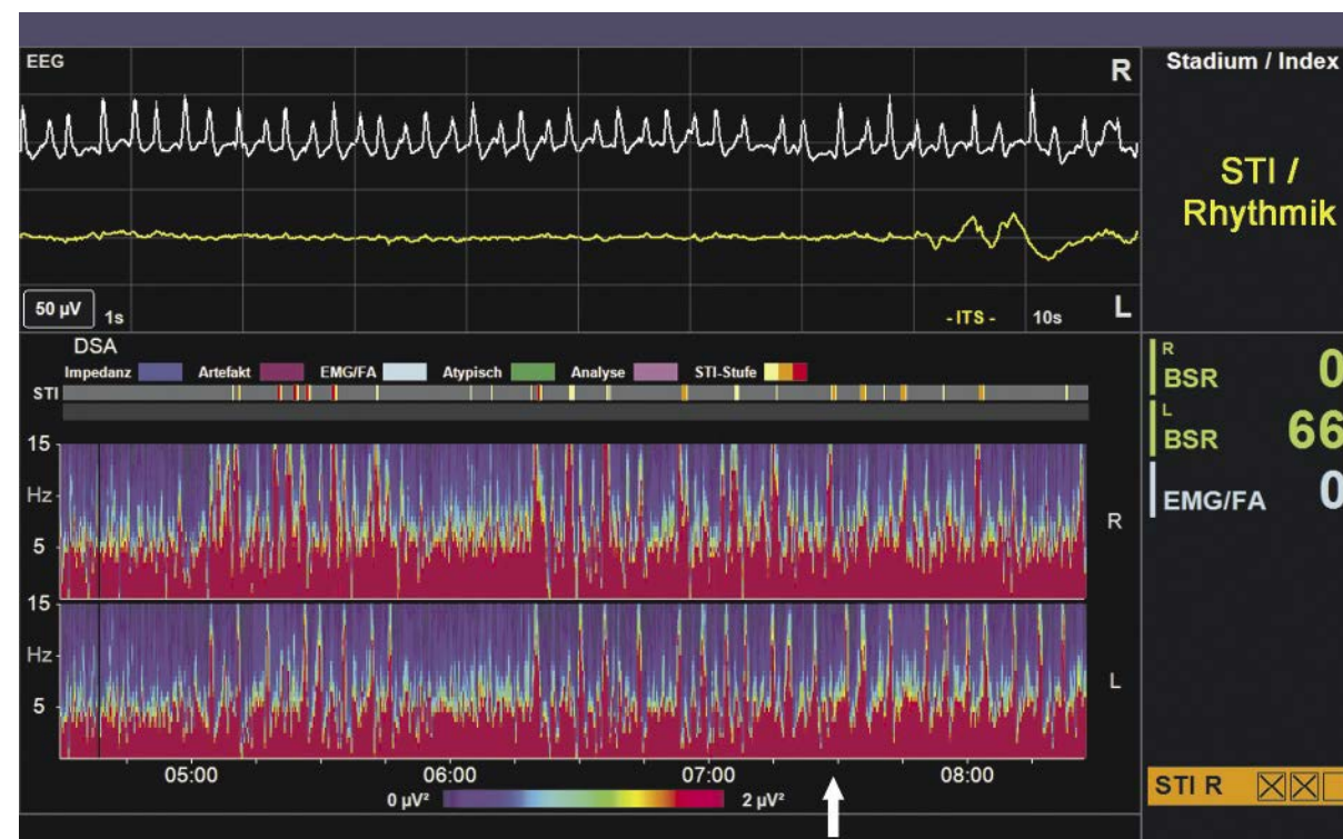
Abb. 2: Original-EEG wie in Abb. 1, untere Bildschirmhälfte: DSA für die Kanäle 1 und 2. Pfeil: aktueller Zeitpunkt des Original-EEG

Arbeitsbelastung auf einer Neugeborenen-Intensivstation dringend benötigt wird. Zu den Vorteilen, die sich laut EFCNI aus der